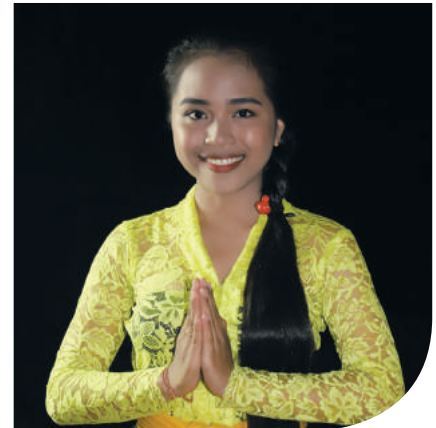
Teks & Foto: Tim Potensi

KEPAK memberikan pelajaran dan pelatihan berharga bagi saya, terutama bagi jiwa remaja kami, yang sedang dalam tahap pencarian jati diri. Lebih memotivasi kami untuk selalu berprestasi dan mawas diri, sehingga bisa membanggakan orang tua, sekolah, bangsa dan negara. P