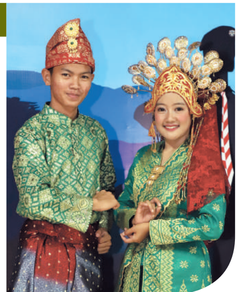
Teks & Foto: Tim Potensi