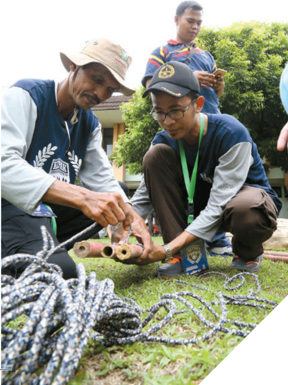
Teks & Foto: Tim Potensi